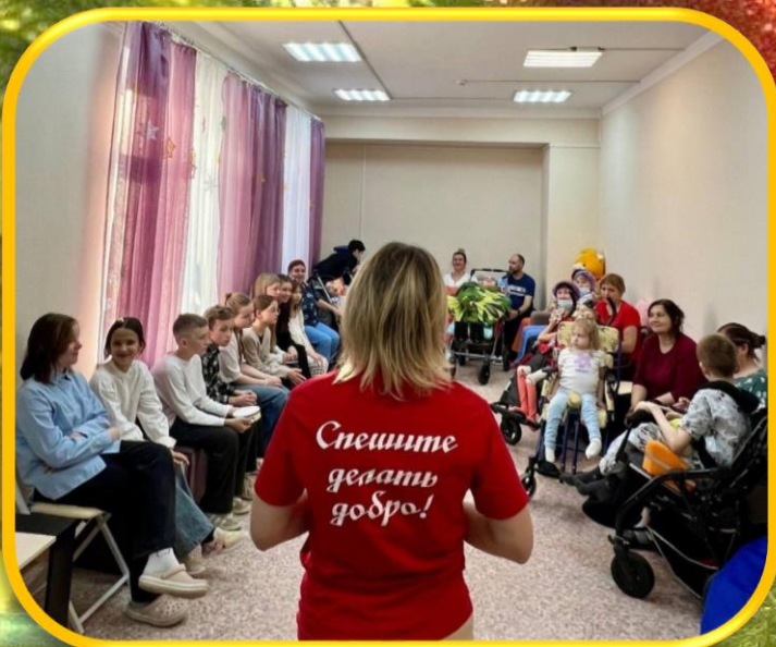
Центр для детей инвалидов

Событие месяца: акция «РОЖДЕСТВЕНСКИЙ ПОДАРОК 2024 продолжается»