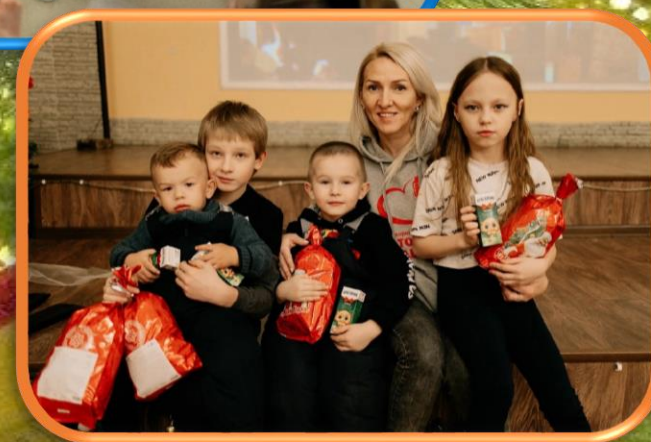
Дети из малообеспеченных семей