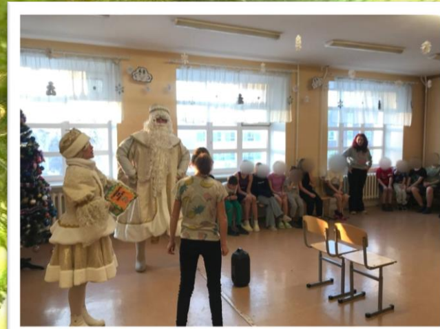
Детское психиатрическое отделение