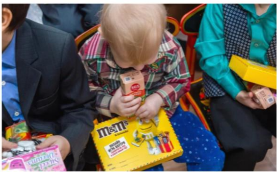
Краевой детский санаторий для больных туберкулезом «Малыш»

Событие месяца: акция «РОЖДЕСТВЕНСКИЙ ПОДАРОК 2024»