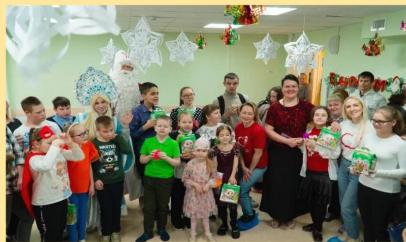
Центр для детей инвалидов